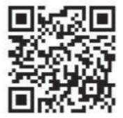
申込フォームはこちら

申し込み方法 所定のフォームから予約申し込みが必要です。 お問合せ先 柳川労働基準協会(柳川商工会議所内) TEL73-7000までお願いします