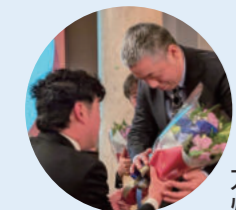
九州B委員会 委員長

また、これまで会を支えてこられた卒業生の皆様へ、感謝を込めて花束と記念品を贈呈いたしました。卒業生スピーチでは、活動を振り返る懐かしい思い出に会場全体が温かな笑顔に包まれ、その功績を改めて深く刻む時間となりました。