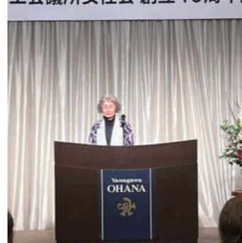
工会議所女性会 創立40周年

式典では、これまでの40年の歩みを振り返りながら、歴代役員・会員の皆様のご尽力に改めて感謝するとともに、今後の活動への決意を新たにす機会となりました。また、ご来賓の皆様からは温かいご祝辞を賜り、女性会のさらなる発展への励ましのお言葉をいただきました。